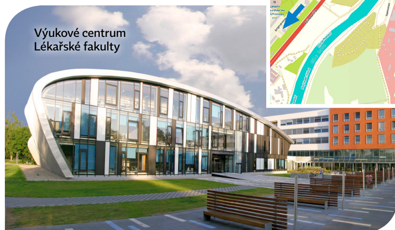
Výukové centrum Lékařské fakulty